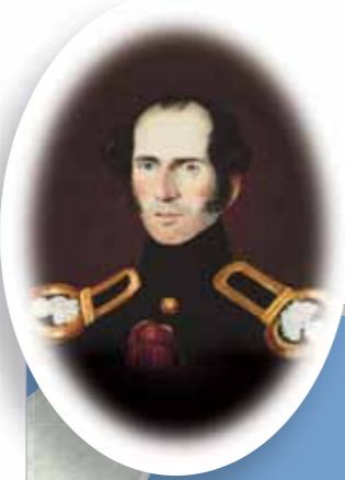
指挥官 Charles O'Hara Booth

医院通常为囚犯医治多种病情，其中包括因为在户外劳作、睡在寒冷的囚室、身穿湿衣服而染上的呼吸疾病或风湿性疾病。到1860年代初期，按照创建一个平静环境等的新思想，许多囚犯都住在贫民站或庇护所接受治疗。庇护所现在包含一个博物馆、囚犯研究中心和博物馆咖啡店。