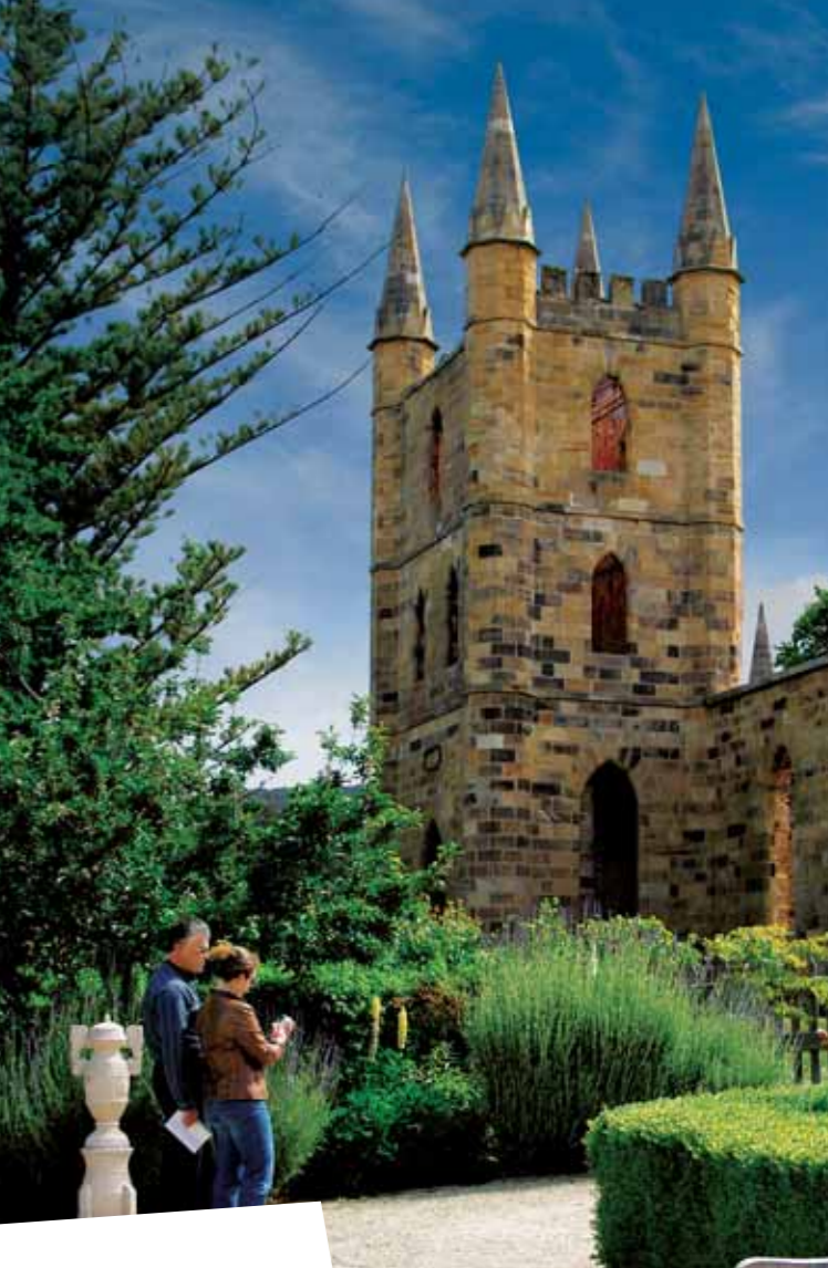
澳大利亚首屈一指的囚犯遗迹